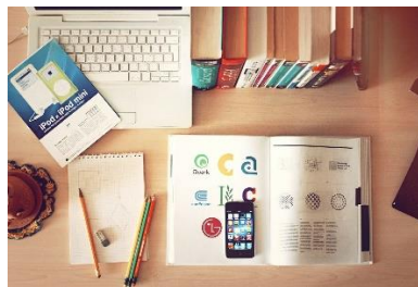
Abbildung 2: Medien

Beispiel für die Verwendungen eines urheberrechtsfreien Bildes: